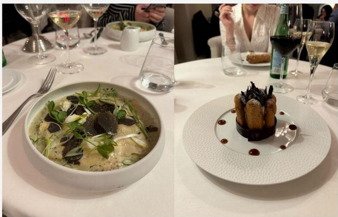
La Storia au Royal Hainaut

Pour ceux qui aimeraient ensuite poursuivre la soirée dans un endroit plus cosy, que celui du bar lounge, il est possible de prendre la direction du royal bar. Un endroit très douillet, où l'on retrouve un billard, des bibliothèques et des fauteuils en velours. Au milieu de la pièce, un imposant bar où un mixologue laisse parler sa créativité. Nous rassurons ceux qui préféreront se coucher directement après le repas, les chambres sont parfaitement insonorisées et situées au calme dans les étages supérieurs.